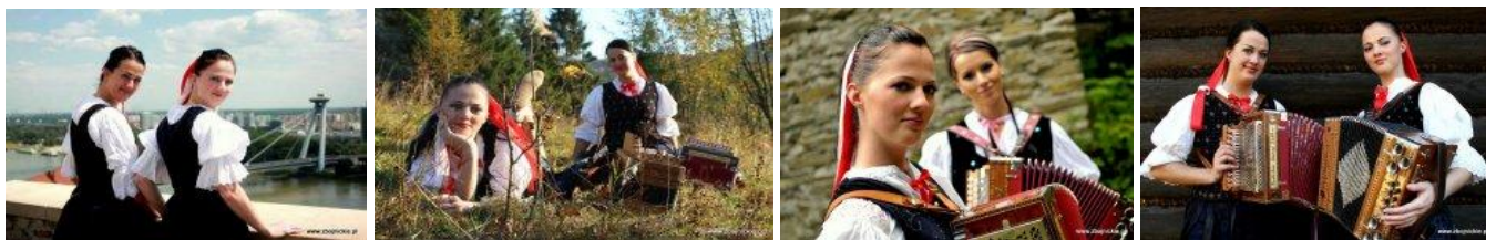
Fot. Heligonistki ze Słowacji.

Zarówno w zamierzchłych czasach jak i obecnie, heligonka umiła rodzinne uroczystości, spotkania z przyjaciółmi, wspólne kołędowania i biesiadowania. Heligonka ożywia atmosferę tych imprez poprzez swoje piękne archaiczne brzmienie i wyjątkowe walory estetyczne, surowe, nieskalane "komercją" specyficzne i charakterystyczne dla Beskidu Żywieckiego.