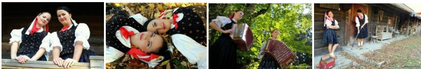
Fot. Heligonistki ze Słowacji.

W muzyce dziewczyn poczuć można ogromną energię i charyzmę oraz brzmienie z dawnych epok w nowoczesnej aranżacji. Heligonistki potrafią przywołać ducha dawnej epoki, wspomnienia z dzieciństwa i młodości naszych pradziadów. Karpackie Zbójce i heligoniści / heligonistki zapraszają na niepowtarzalną imprezę, zagrąną na heligonkach w unikatowej aranżacji!