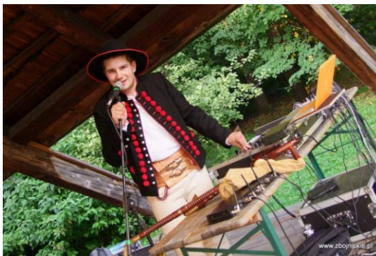
Fot. DJ Janosik w akcji.