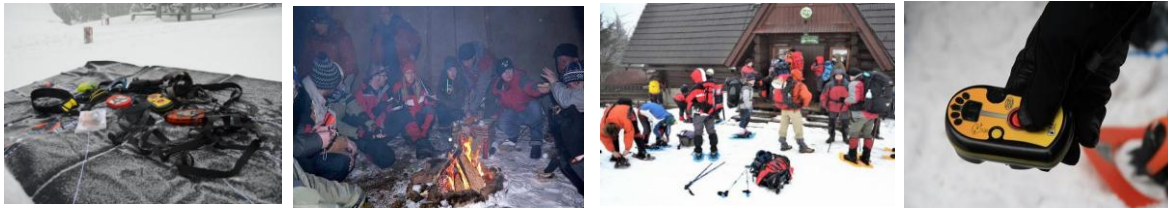
Fot. Poszukiwania skarbu harnasia zimą.

w kazamatach więziennych, gdzie był więziony długie dni, napisał list dla swoich kompanów z cennymi wskazówkami, gdzie ukrył legendarny skarb. List odnaleziony przez strażnika zamkowego trafił do zbójników. Zbójnicy dowiedziawszy się jak drogocenny jest to skarbu utworzyli rywalizujące ze sobą grupy , mające na celu jak najszybsze odnalezienie cennego łupu na podstawie wskazówek umieszczonych w liście. Każdy z uczestników imprezy integracyjnej, który skusi się na tego typu atrakcje, będzie mógł poczuć zbójnicki klimat z czasów najsłynniejszego karpackiego zbójnika Juraja Janosika .