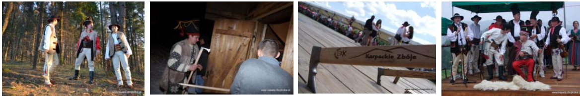
Fot. Poszukiwania skarbu harnasia latem.

Do każdego zbójnickiego zespołu przydzielony zostaje instruktor z górkim odbiornikiem GPS , uczestnicy zostają przeszkoleni z zakresu obsługi tego urządzenia. Do dyspozycji zespołu oddamy również bardzo dokładną topograficzną mapę terenu . Instruktor pokonuje trasę wraz z grupą i służy pomocą w awaryjnych sytuacjach. Aby dotrzeć do kolejnego punktu uczestnicy posługują się GPS-em i mapą . Na zawodników czekają zadania, za które zdobywają punkty. Gdy zbój - zabawę robimy zimą to za pomocą detektora lawinowego i sond lawinowych drużyny muszą odnaleźć wskazówki, poza tym czekają na nich zadania logiczne . W punktach kontrolnych uczestnicy marszu będą też udzielać pierwszej pomocy i uczestniczyć w pokazie ratownictwa górskiego . Szukanie Skarbu Janosika to idealny pomysł na integrację i pracę w zespole.