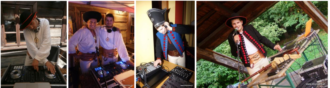
Fot. DJ Janosik w akcji.

Zobacz więcej zdjęć z naszych zbójnickich eventów!